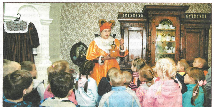
В гостях у Лисы-мешаночки

Учредитель: МБДОУ «Детский сад «Улыбка».