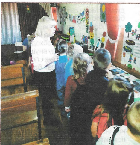
Выставка в ДДТ