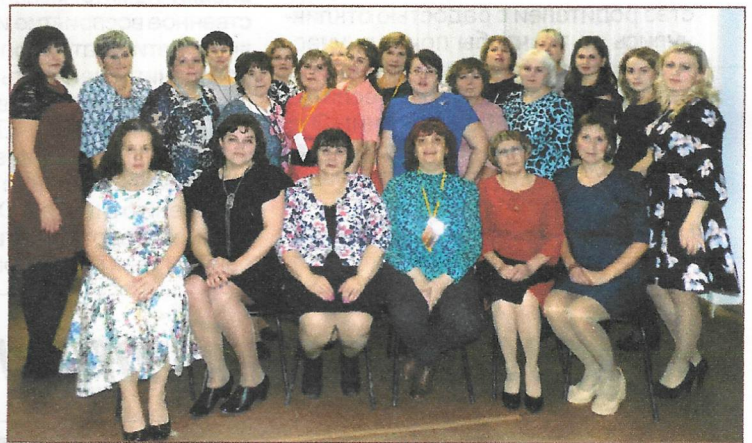
Педагоги в гостях у пешуковцев