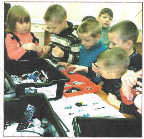
На экскурсии в школе