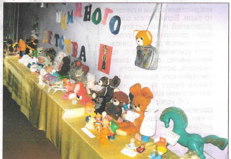
Выставка игрушки маминного детства