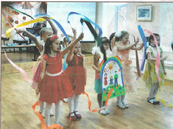
Поздравляют дети, юбилей КСЦО